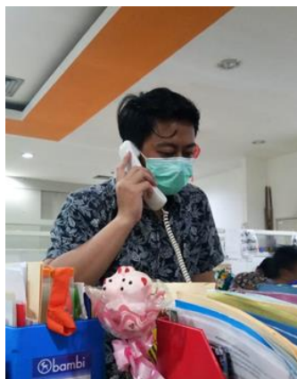
PT Hakiki Donarta

Jumlah Perusahaan yang Diberikan Asistensi Online Sebanyak 1 Perusahaan