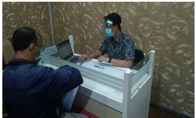
PT Karyamitra Budisentosa