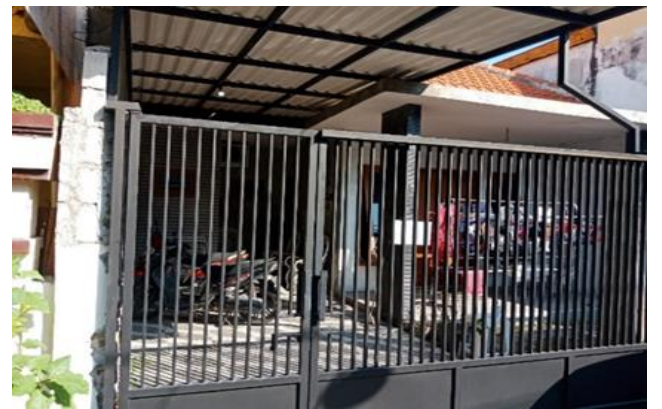
Jl. Ngagel Mulyo XIII No. 5