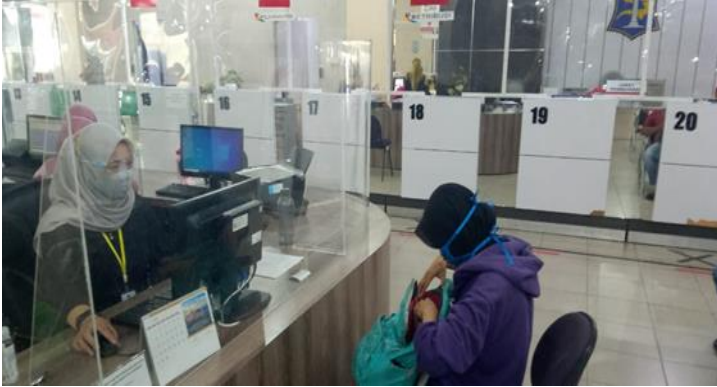
Pelayanan Loker Informasi