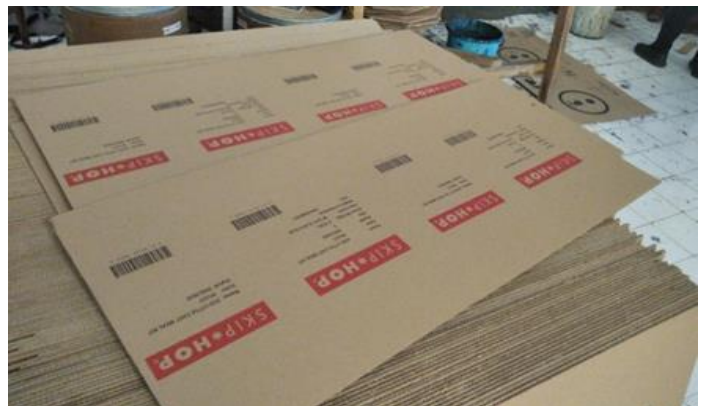
PERUSAHAAN PERORANGAN ANUGRAH INTI MAKMUR Jl. Margomulyo Indah Blok F No 18 Surabaya