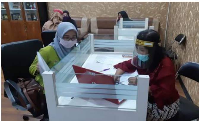
PT Rukma Padaya Trans