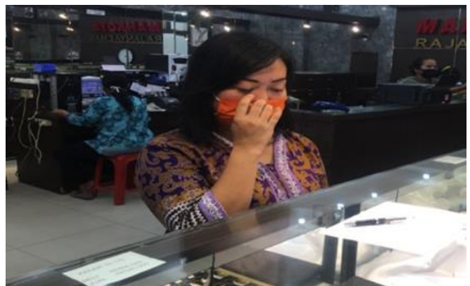
Galeri Emas Mahkota Jl. Pogot No. 29