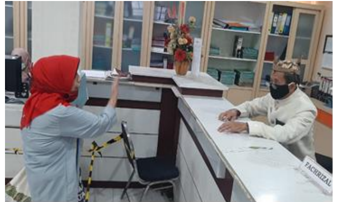
Pelayanan Loker Pengambilan

Jumlah Permohonan Perizinan Yang Masuk Sebanyak 84 Berkas