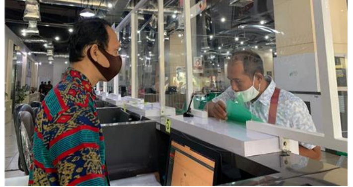
Pelayanan Loker Pengambilan