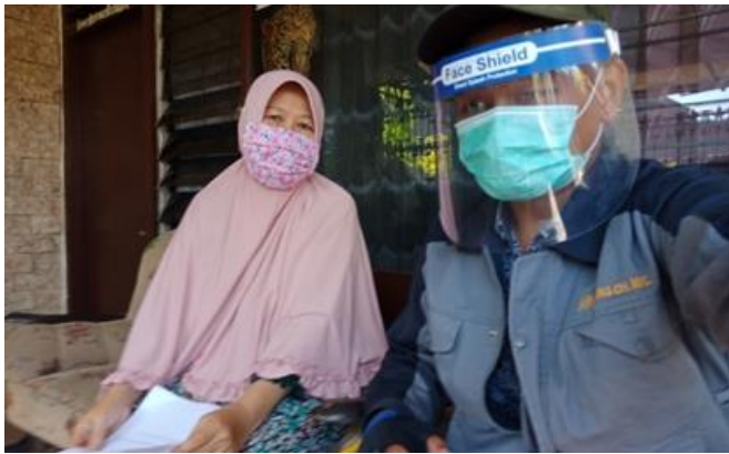
Jl. Ngagel Mulyo VII No. 32