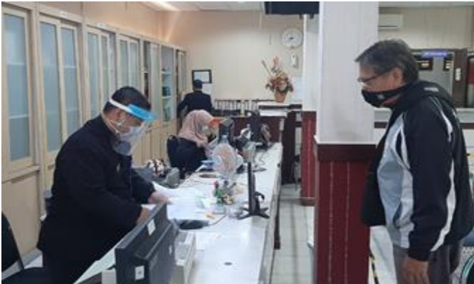
Pelayanan Loker Retribusi Izin Pemakaian Tanah