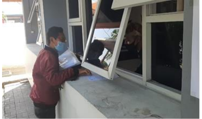
Pelayanan Loker Informasi