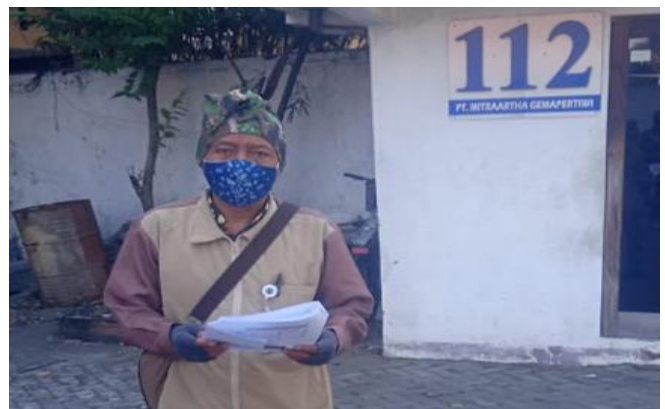
PT Mitraartha Gemapertiwi Jl. Rajawali No. 112