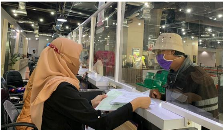
Pelayanan Loker Customer Services