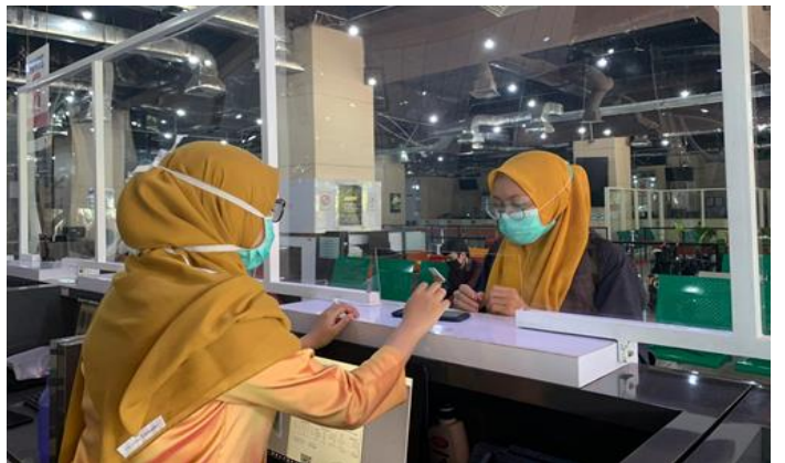
Pelayanan Loker Mandiri

Jumlah Permohonan Perizinan Yang Masuk Sebanyak 109 Berkas