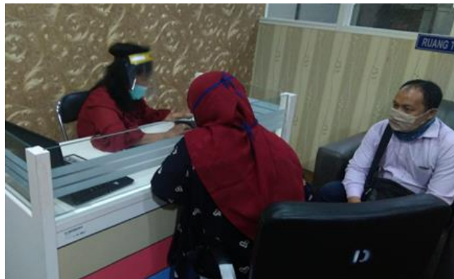
PT Sumber Bina Setia

Jumlah Perusahaan yang Diberikan Pengawasan Sebanyak 5 Perusahaan