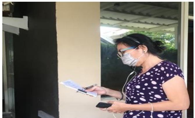
UD Garmendo Pupuwi Jl. Wisma Permai 9 No. 12