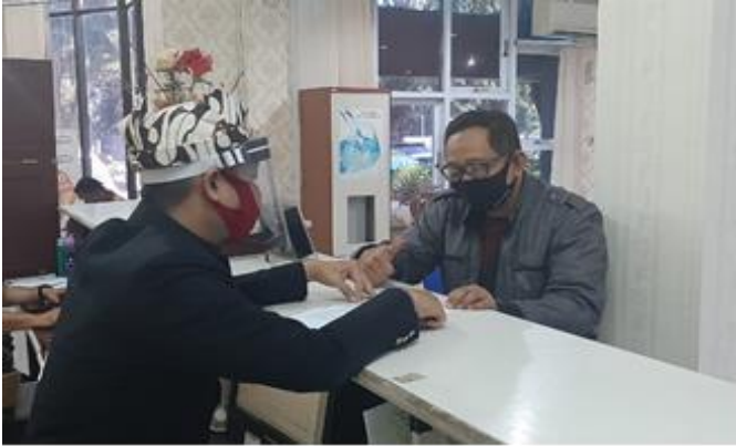
Pelayanan Loker Customer Service