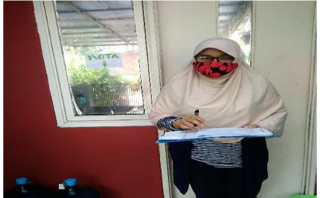
Pizza Riza Jl. Palm Sememi Raya B/24 (40-A)