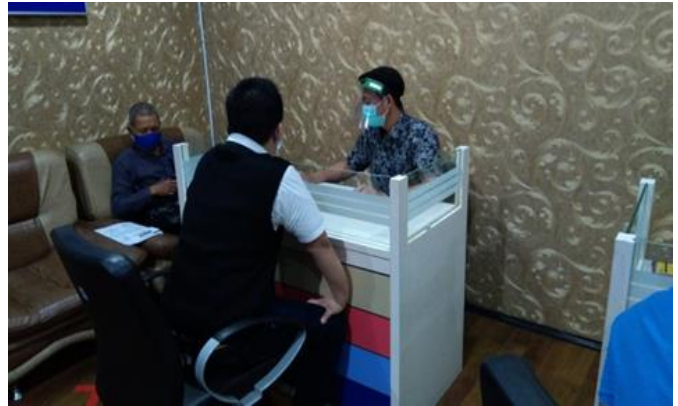
PT Premium Parfum Indonesia