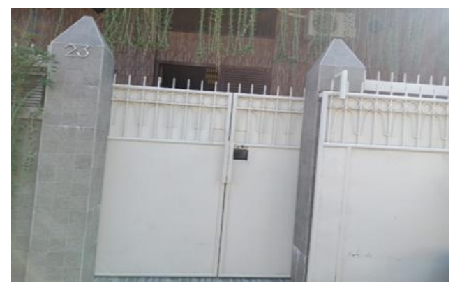
Jl Ngagel Mulyo VII No 23