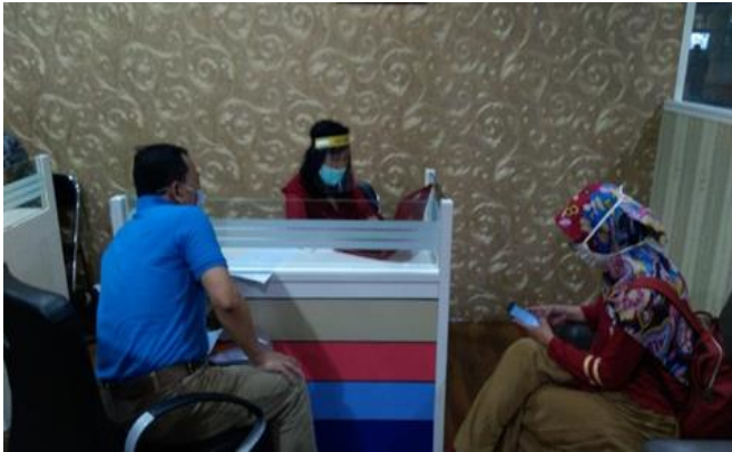
PT Ote Engineering