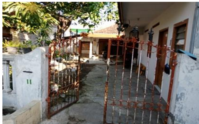
Jl. Ngagel Dadi 1 H No. 11