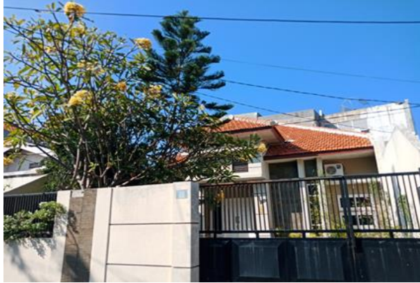
Jl. Bratang Gede No 179