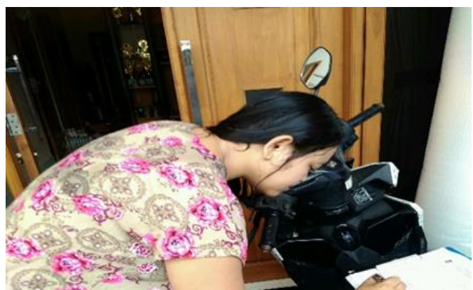
Kris Cosmetics Jl. Manukan Subur VII / 16