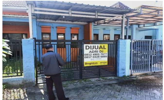
CV Afrin Jl. Palm Sememi Tengah 6/23